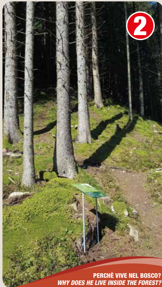
PERCHÈ VIVE NEL BOSCO? WHY DOES HE LIVE INSIDE THE FOREST?