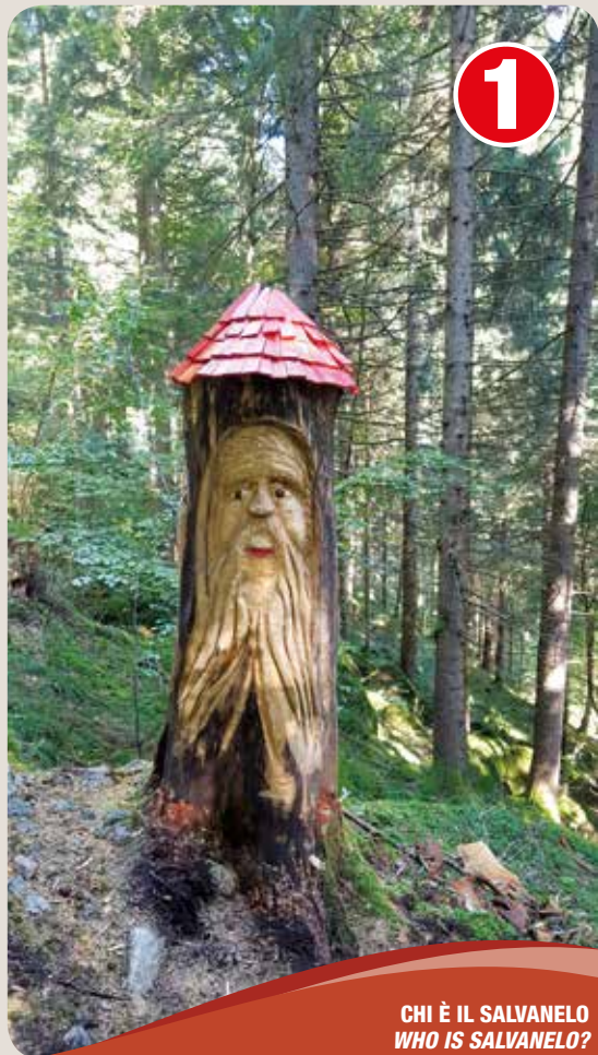
CHI È IL SALVANELO WHO IS SALVANELO?