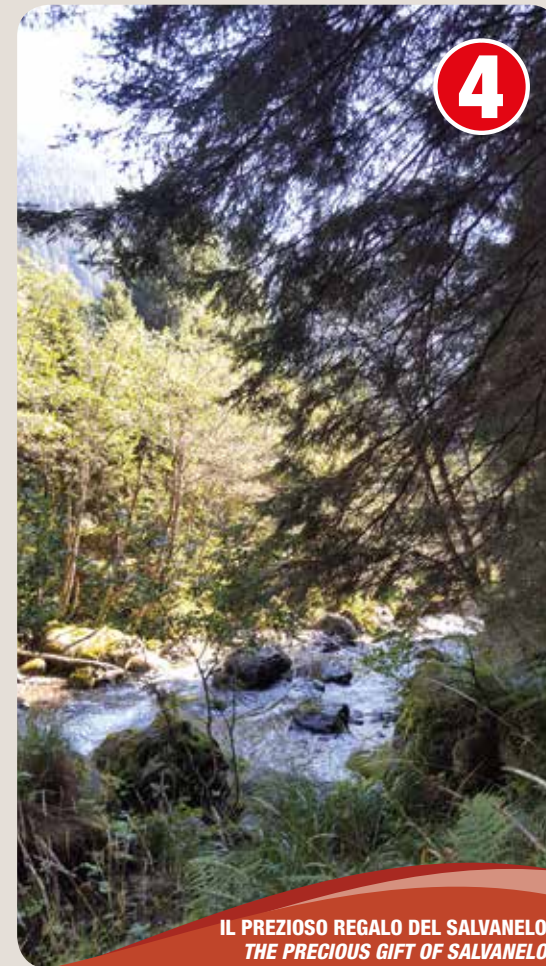
IL PREZIOSO REGALO DEL SALVANELO THE PRECIOUS GIFT OF SALVANELO