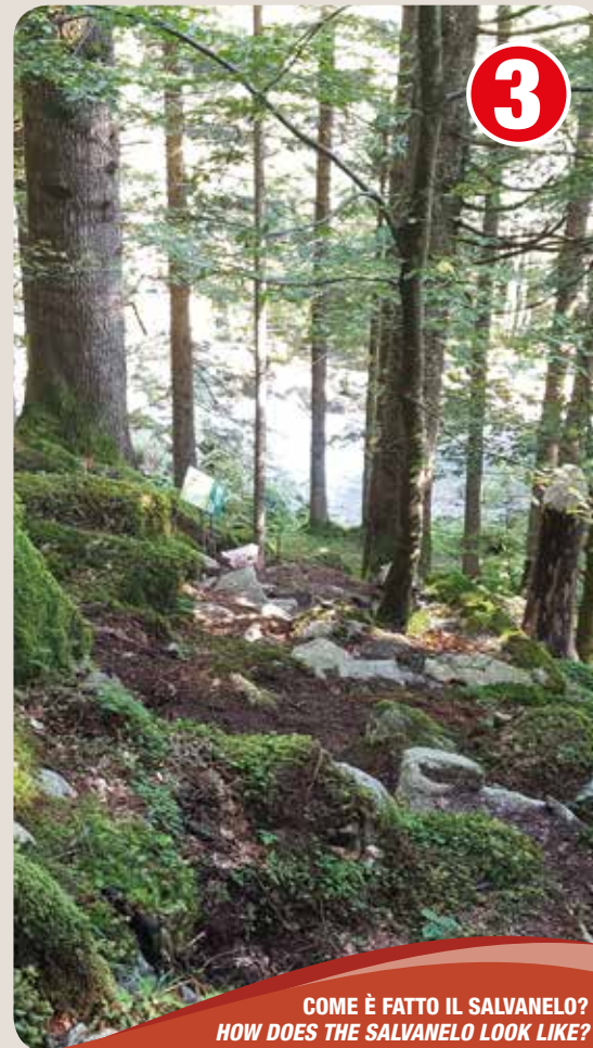
COME È FATTO IL SALVANELO? HOW DOES THE SALVANELO LOOK LIKE?