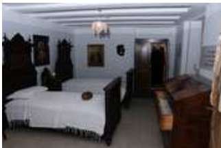
La Casa Andriollo