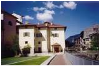
Il Museo della Grande guerra-