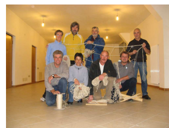
I partecipanti al primo corso "reati"

Se soci e simpatizzanti dell'Associazione avessero idee e proposte su nuove iniziative in questo settore, le possono comunicare al referente dell'Ecomuseo.