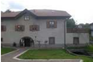
La casa degli spaventapasseri

Due sono le iniziative che coinvolgono l'Ecomuseo del Lagorai attualmente in atto che hanno l'obiettivo di mettere in rete le realtà soggette diversi sul territorio valsuganotto e provinciale. Entrambi sono stati finanziati dalla Fondazione Cassa di Risparmio di Trento e Rovereto in seguito a un invito a presentare proposte lanciato nel 2008.